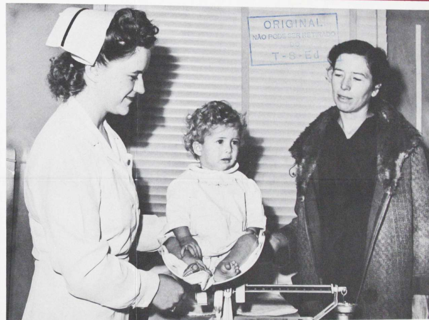
As crianças são pesadas e examinadas regularmente, indicando-se dietas especiais quando necessário.